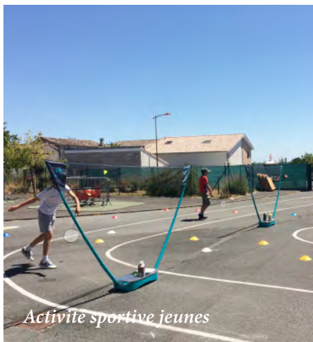
Activité sportive jeunes